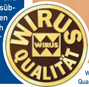
WIRUS Türen repräsentieren Qualität. Dafür steht das Qualitätssiegel, das Sie an ausgewählten WIRUS Türen finden.