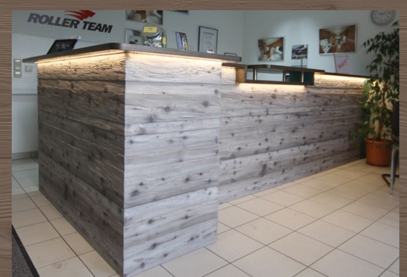
434 dunkel gehackt / dark chopped